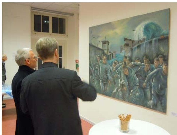
Bildmotiv Mauerflutung