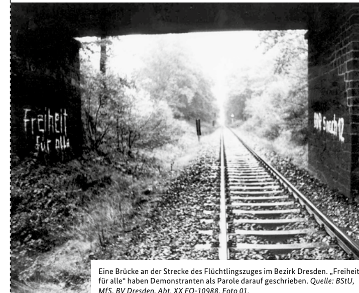
Eine Brücke an der Strecke des Flüchtlingszuges im Bezirk Dresden. „Freiheit für alle“ haben Demonstranten als Parole darauf geschrieben.

Am 30. September 1989 besuchte der Bundesaußenminister Hans-Dietrich Genscher die Prager Botschaft und verkündete, dass alle DDR-Flüchtlinge ausreisen können. Bereits einen Tag später rollten die ersten Sonderzüge – verantwortlich dafür war die Stasi unter der Bezeichnung „Aktion Zug“.