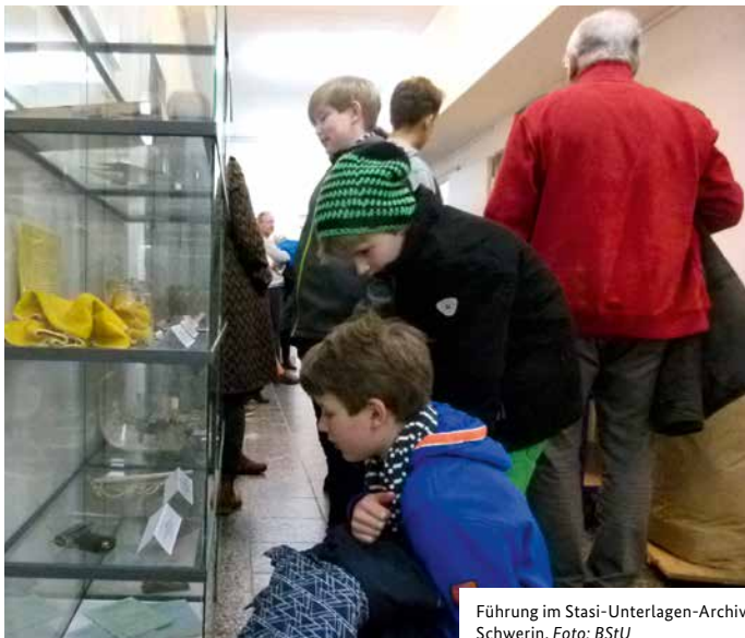
Führung im Stasi-Unterlagen-Archiv Schwerin