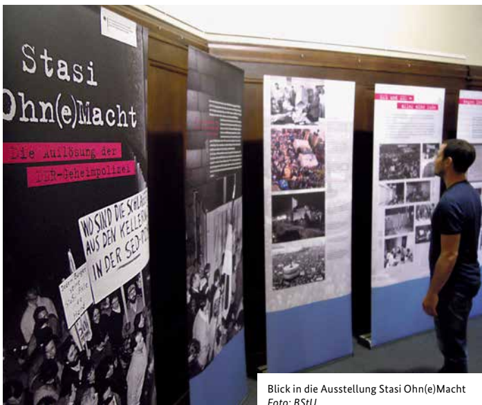
Blick in die Ausstellung Stasi Ohn(e)Macht